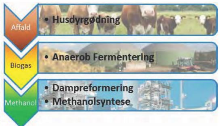
Biomethanol Flydeskema – Fra husdyrgødning til Grøn Benzin.

Den mulighed får de nu med et nyt dansk initiativ. Et nystiftet selskab DANSK BIOMETHANOL har sat sig for at samle kræfter og kapital, der kan løfte opførelse af verdens første kombinerede biogas- og methanolværk.