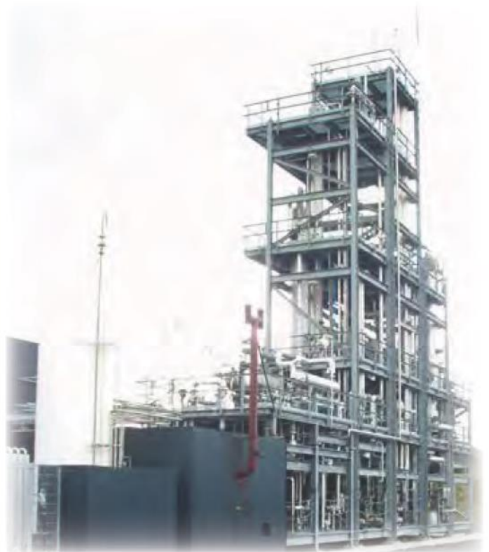
George Olah Renewable Methanol Plant på Island.

Sammen med vore islandske venner råder vi nu over gennemprøvet teknik til at lave endnu mere biomethanol af vor vindmøllestrøm den dag, vi bliver bedt om det. Det vil give vore elværker optimale driftsbetingelser uden hensyn til den ustyrlige vind.