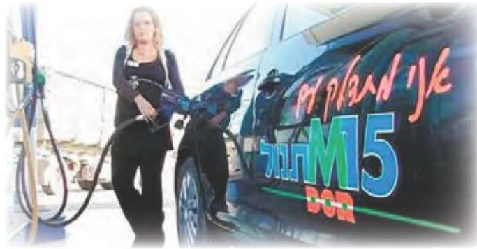
Israelsk bilist tanker M15 - Benzin med 15% methanol.

Også Israel mangler flydende brændstof. Hvor Kina fremstiller methanolen af kul, så tyer Israel til solen som kraftkilde. I små minireaktorer cracker de kuldioxid og vand til en syntesegas – det vi i gamle dage kaldte generatorgas. Det er denne gas, der omdannes til methanol og Agro Industries er inviteret med i udviklingen af denne del.